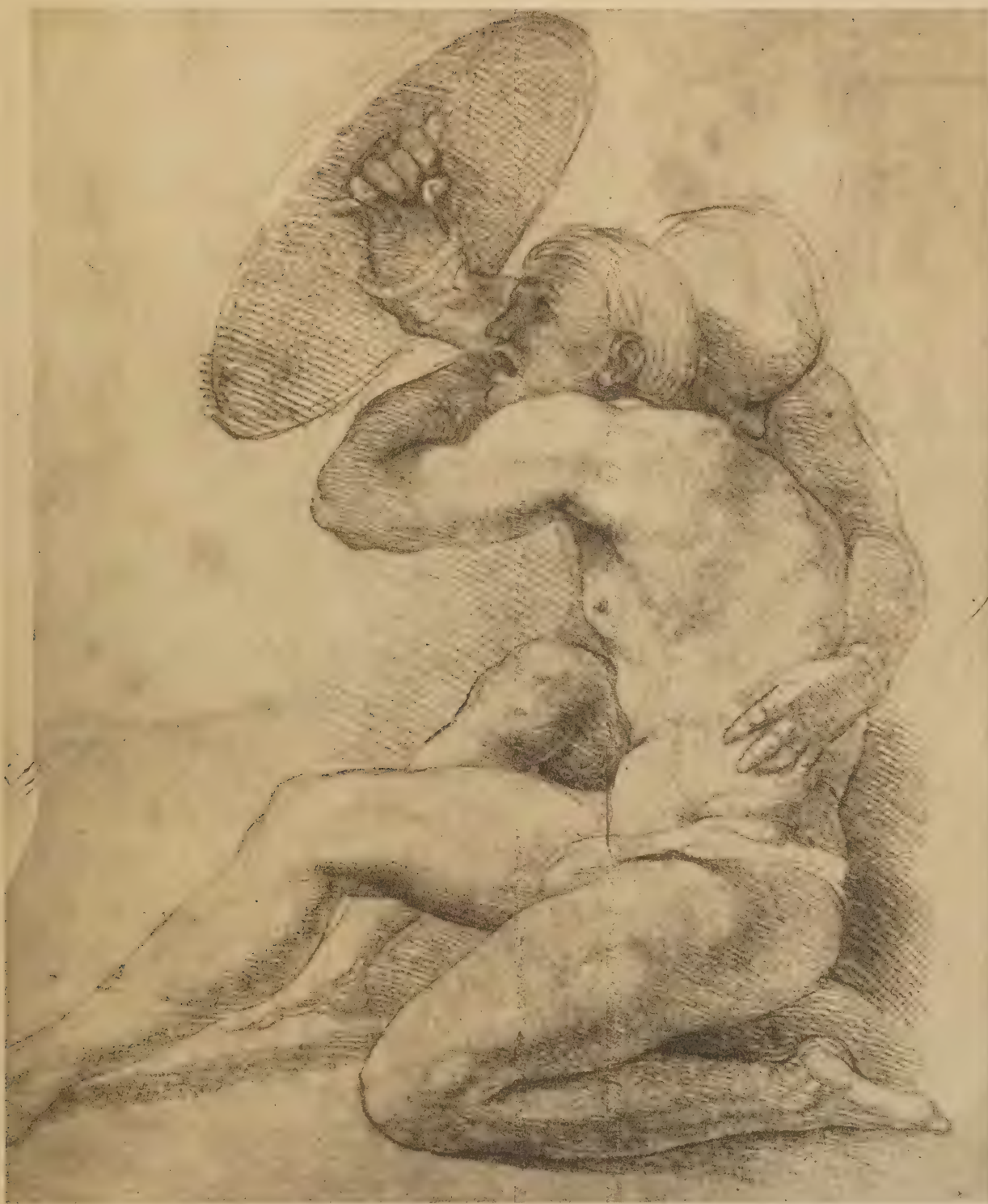
Etude de deux guerriers